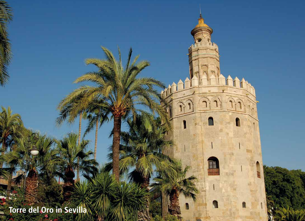
Torre del Oro in Sevilla