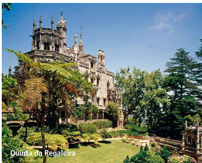
Quinta da Regaleira