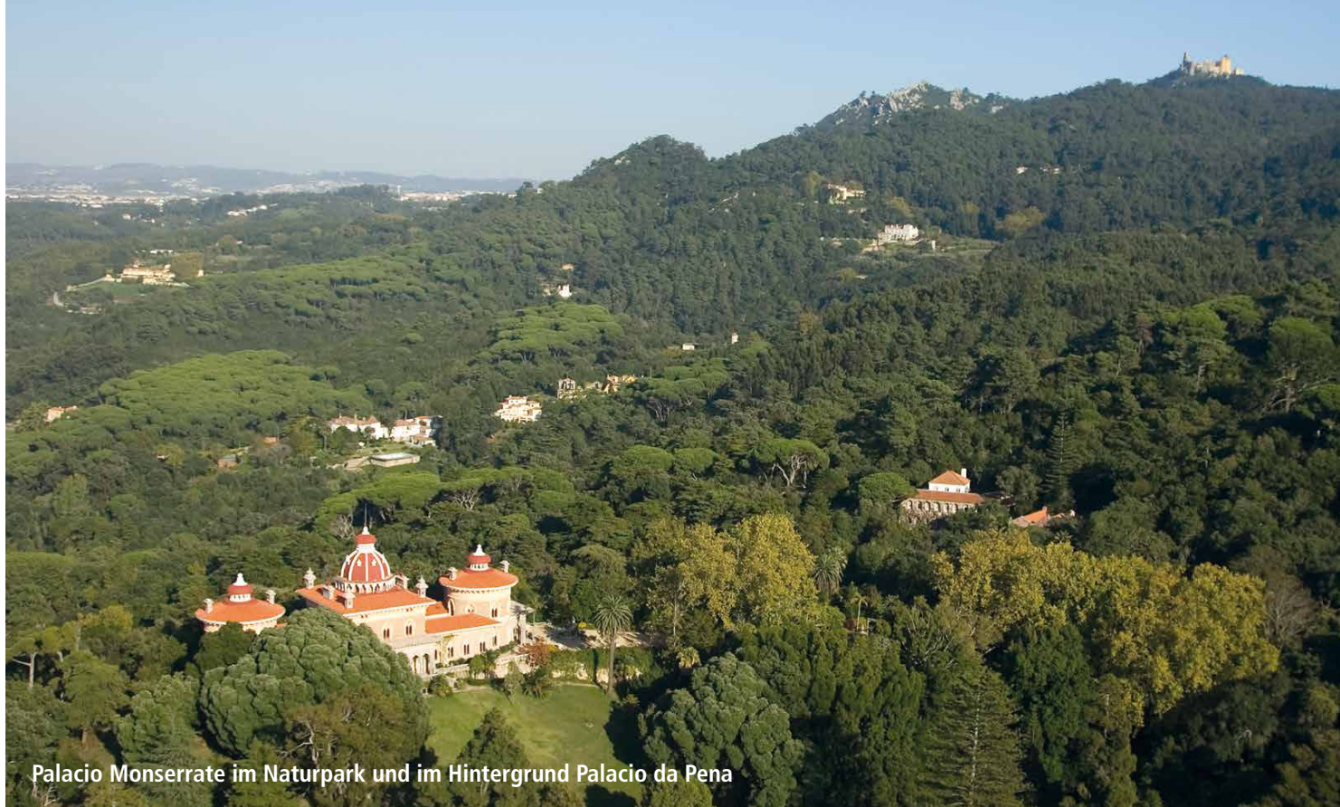
Palacio Monserrate im Naturpark und im Hintergrund Palacio da Pena