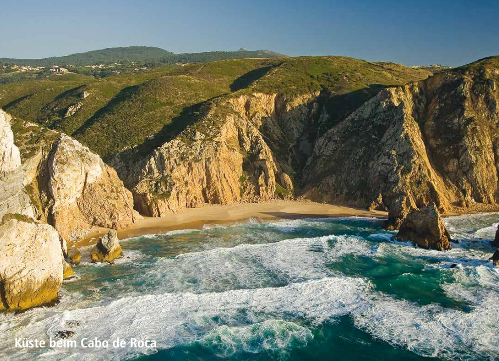
Küste beim Cabo de Roca